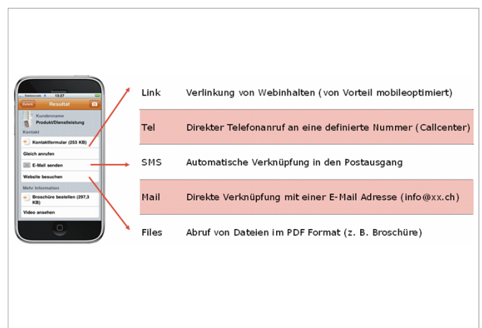
Beispiel «Interaktionsmöglichkeiten» (Screenshot)