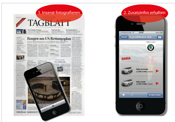
Beispiel «Einfache Usability» (Screenshot)

Entscheidungsgrundlagen erhalten und danach Käufe auslösen – mit diesen Vorteilen machen Smart Ads den ersten Schritt in die interaktive «Print-Plus-Welt». Das Angebot wird in nächster Zeit laufend ausgebaut. Ziel ist, die smarte Werbeform auch im Rubrikenmarkt und bei weiteren Werbeformaten anzubieten. Dank dieser dynamischen Interaktivität kommen sich Angebot und Nachfrage so nahe wie noch nie.